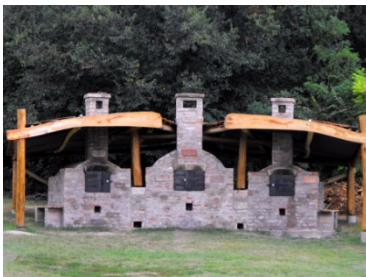
1. ábra A verebi Háromszájú Kemence

A település vezetői, lakói, civil szervezetei minden forintot megragadnak, rendszeresen pályáznak LEADER pályázat, Közkincs, NKA, Zöldövezet program. Most pedig a településen a szennyvízelvezetés és -tisztítás európai szintű megoldása a Velencei-tó, valamint a közvetlen táji környezet védelme érdekében, a településen teljes mértékben kiépül a csatornahálózat. A költségvetés figyelembevételével, ami lehet önerőből valósítanak meg összefog a falu aprajánagyja.