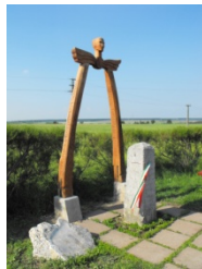
2. ábra Pogánykő